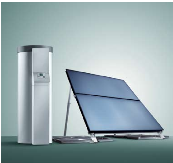
Solarsystem auroSTEP med 2 pladesolfangere